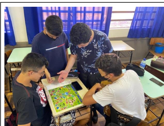
Foto 2 – Alunos da EMEF Maria Dulcina jogando o jogo de tabuleiro do PEA.

A distribuição dos materiais ocorreu por meio dos correios, pois seguindo os protocolos sociais adotados para o período de pandemia, as ações presenciais do PEA nas escolas estão adiadas até que se reestabeleça as aulas sem as oscilações presencial/híbrido no calendário escolar. Portanto, os materiais impressos foram enviados para a Escola Municipal de Ensino Fundamental Faxinalzinho e Escola Indígena Maria k. Keso, do município de Faxinalzinho/RS, para a Escola Municipal de Ensino Fundamental Maria Dulcina e Escola Municipal de Ensino Fundamental Adilio Daronchi, do município de Nonoai/RS e para as correspondentes Secretarias Municipais de Educação juntamente com uma carta explicativa, do qual pedimos um retorno de registros fotográficos do recebimento do material – Foto 2 a Foto 5.