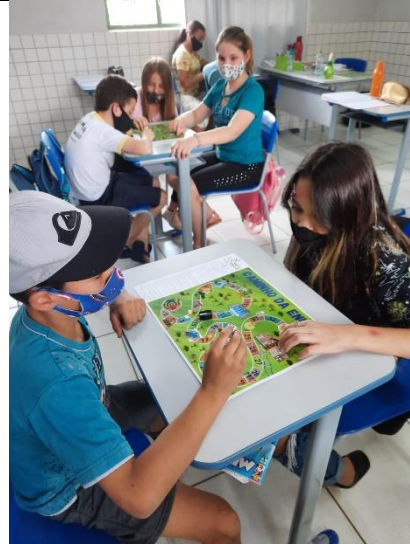
Foto 9 – Registro dos alunos da EMEF Faxinalzinho com o jogo de tabuleiro.