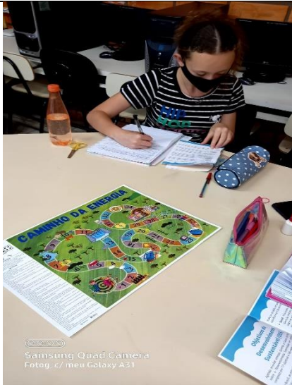
Foto 4 – Registro de estudante da EMEF Adilio Daronchi com as cartilhas e jogos pedagógicos do PEA.