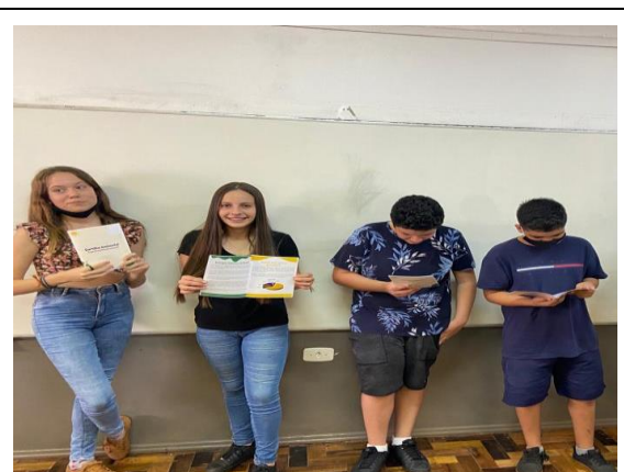
Foto 3 – Estudantes da EMEF Maria Dulcina representando o recebimento dos materiais pedagógicos do PEA na escola.