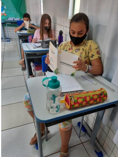
Foto 8 – Registro dos alunos da EMEF Faxinalzinho com as Cartilhas Ambientais.