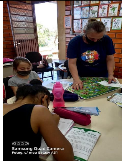
Foto 5 – Alunos e Professora da EMEF Adilio Daronchi com os materiais pedagógicos do PEA da UHE Monjolinho.