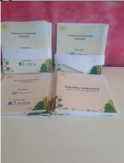
Foto 6 – Registro do recebimento do material pedagógico pela Escola Indígena Maria K. Keso.