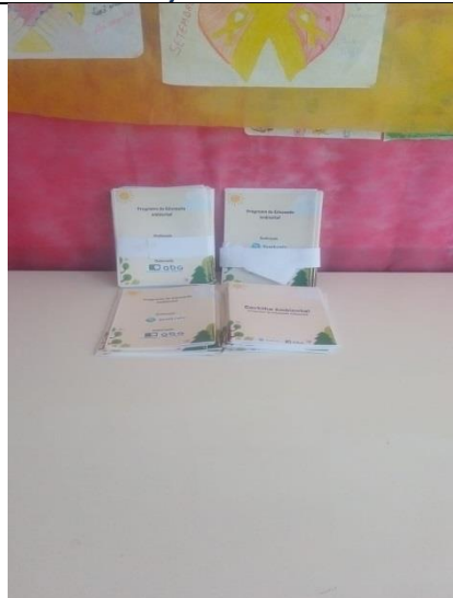
Foto 7 - Registro do recebimento do material pedagógico pela Escola Indígena Maria K. Keso.