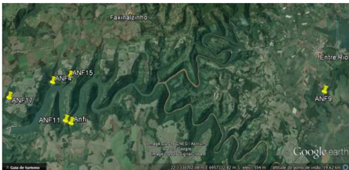
Figura 1. Pontos de amostragem de L. macroglossa , V. uranoscopa e L. catesbeianus , na área de influência e na área próxima da UHE Monjolinho, rio Passo Fundo.

Além das metodologias supracitadas para cada espécie serão utilizadas metodologias específicas, citadas abaixo: