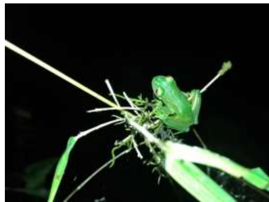
Foto 5. Juvenil de Vitreorana uranoscopa registrados no ponto ANF4.