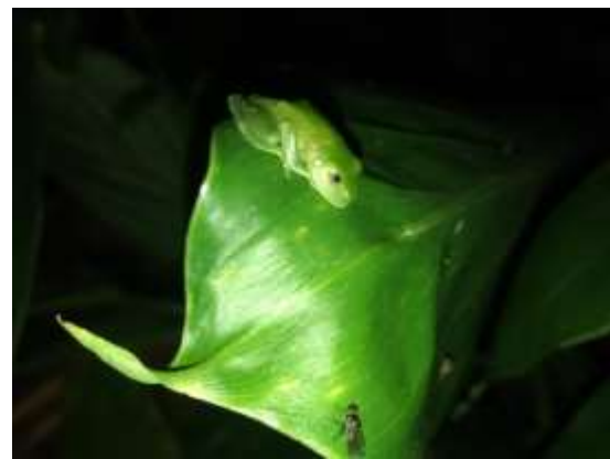
Foto 6. Juvenil de Vitreorana uranoscopa registrados no ponto ANF4.