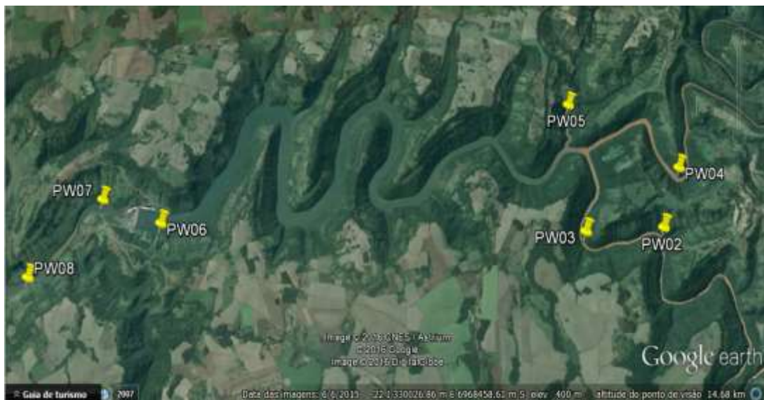
Figura 2. Pontos de amostragem de P. williamsi na área de influência da UHE Monjolinho, rio Passo Fundo.

Os pontos de amostragem situam-se em toda a área de influência da UHE Monjolinho e pontos pré-definidos baseados em registros anteriores ou locais com perfil adequado para ocorrência dos cágados-rajados (Figura 2). A partir da utilização de técnicas de captura-marcação-recaptura será possível estimar futuramente a população local e o deslocamento destes animais no leito do rio Passo Fundo.