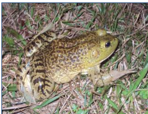
Exemplar de Lithobates catesbeianus .

Quando uma espécie foi introduzida pelo homem em um determinado local, essa espécie é considerada exótica . No Brasil, por exemplo, a espécie Lithobates catesbeianus (rã-touro) é considerada uma espécie exótica.