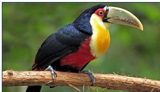
Exemplar de Ramphastos dicolorus .