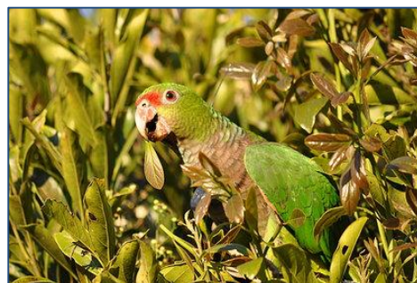
Exemplar de Amazona vinacea .