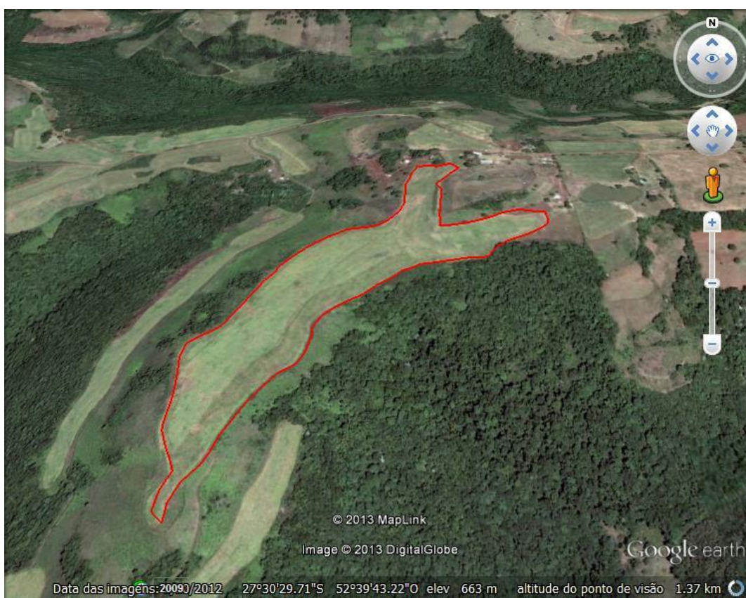
FIGURA 01: Mapa da coletiva 01

Esta área está localizada na coordenada J335712.41 E6956149.02. A mesma possui uma área total de 9,60 hectares, onde será destinado ao cultivo da milho.