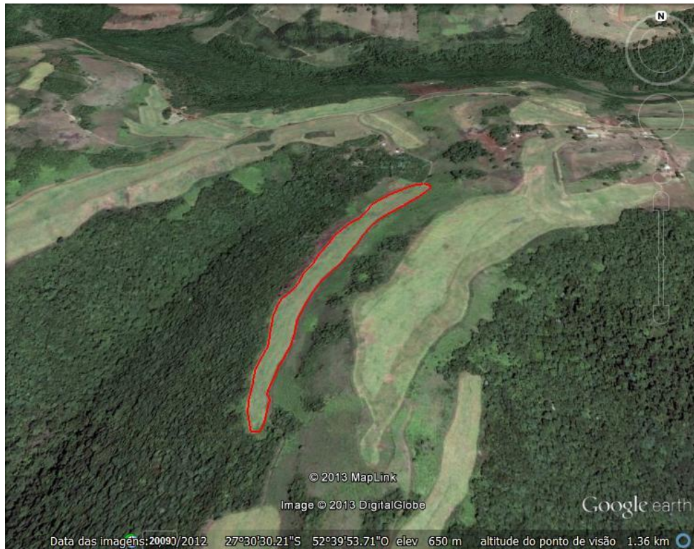
FIGURA 02: Mapa da Coletiva 02

Esta área está localizada na coordenada J335484.29 E6956173.82. A mesma possui uma área total de 2,60 hectares, onde será destinado ao cultivo da Soja