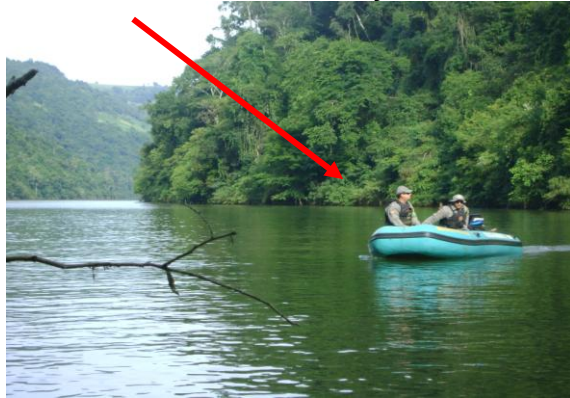
FOTO 02 Rede de pesca encontrada no reservatório