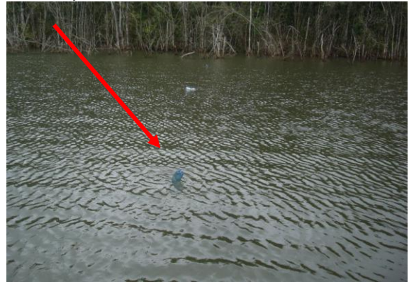
FOTO 03 Embarcação encontrada no reservatório