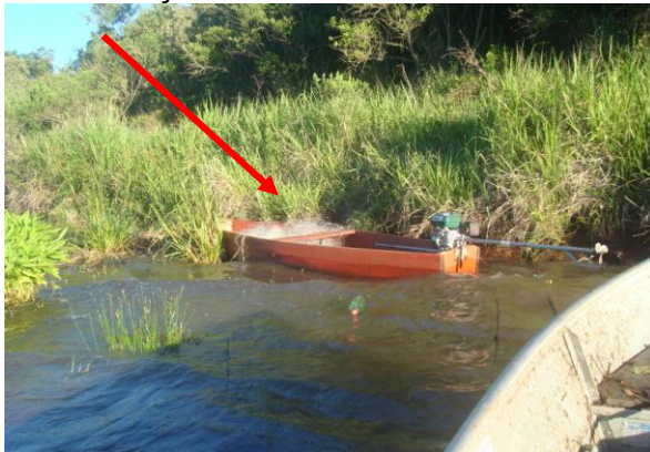
FOTO 04 Policial realizando a retirada de redes