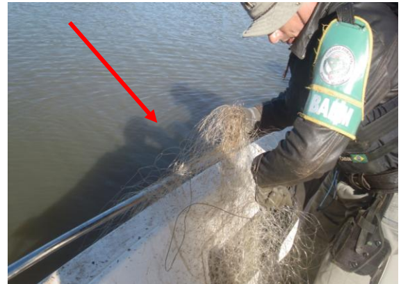
FOTO 05 Identifica a retirada de rede de pesca